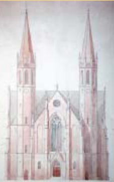
Friedrich Stülers Entwurf aus dem Jahr 1864