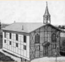
Behelfskirche ab 1865

Evangelische Zwölf Apostel Kirchengemeinde